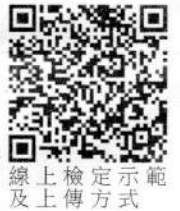
線上檢定示範及上傳方式