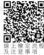
線上檢定流程及注意事項