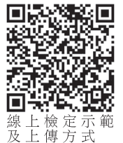
線上檢定示範及上傳方式