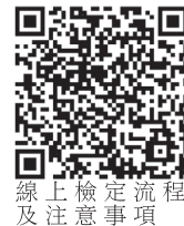
線上檢定流程及注意事項