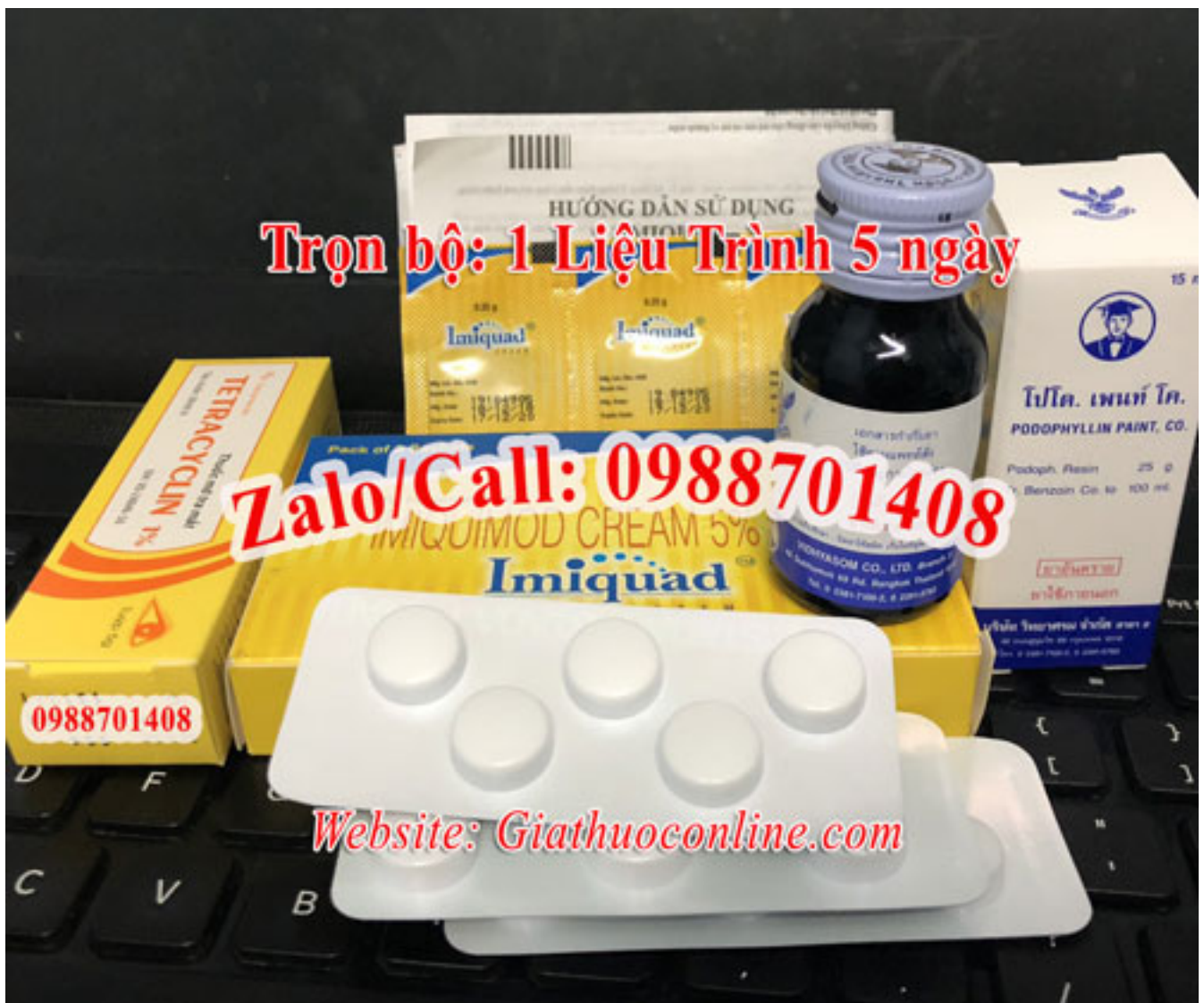
28 Hình ảnh sùi mào gà Giai Đoạn Đầu ở Nữ Nam

cũng là một cách để chữa trị bệnh lý sùi mào gà. Thuốc trị sùi mào gà tại nhà được áp dụng cho những trường hợp bị bệnh sùi mào gà nhẹ, tổn thương ít, hoặc chưa xuất hiện những thương tổn.