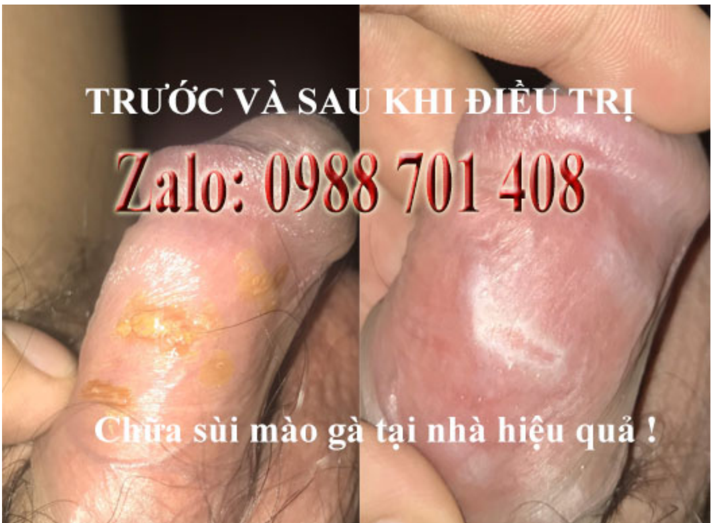
28 Hình ảnh sùi mào gà Giai Đoạn Đầu ở Nữ Nam