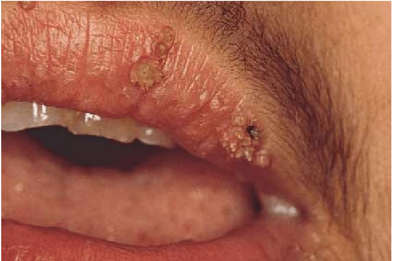
Hình ảnh bệnh sùi mào gà tại tại vùng môi

Bệnh mào gà ở họng môm là nguồn gốc chủ yếu dẫn đến các ung thư miệng như là ung thư môi, ung thư lưỡi, ung thư hạ họng thanh quản và vòm họng. Bởi vậy thời điểm nhận ra 1 mụn nhọt thịt nổi đến tại vùng miệng họng người bị bệnh cần phải đi thăm khám nhanh chóng để được bác sĩ khám cùng với chữa sớm