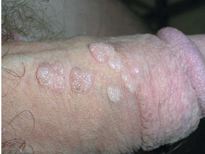
Hình ảnh bệnh mồng gà ở thân cậu nhỏ