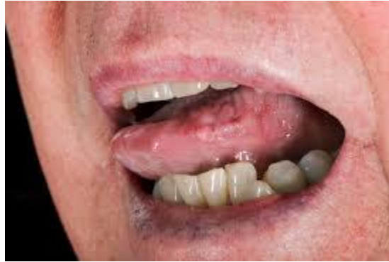
Hình ảnh bệnh mỏng gà ở khu vực môi