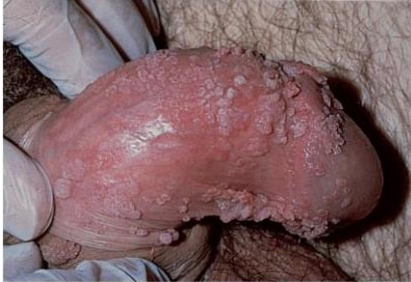
Hình ảnh bệnh mồng gà lan rộng toàn bộ âm đạo đàn ông