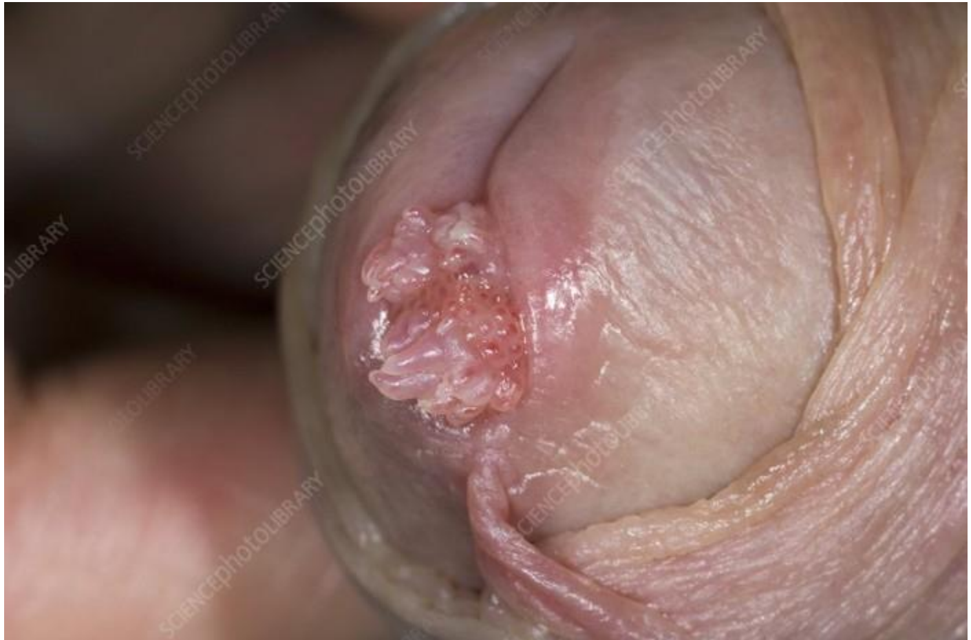
Hình ảnh bệnh mồng gà miệng sáo kích thước lớn

Hết thời điểm ủ bệnh, các biểu hiện thứ nhất của bệnh lí bệnh mồng gà sẽ gây nên. Thường là thời điểm cơ thể ốm kém hệ miễn dịch giảm sút hệ miễn dịch kém vậy virút Hpv sẽ biến chuyển gây ra một vài hình ảnh sùi mào gà giai đoạn đầu. Bệnh nhân buộc phải tinh tế để mua xuất điều đó: