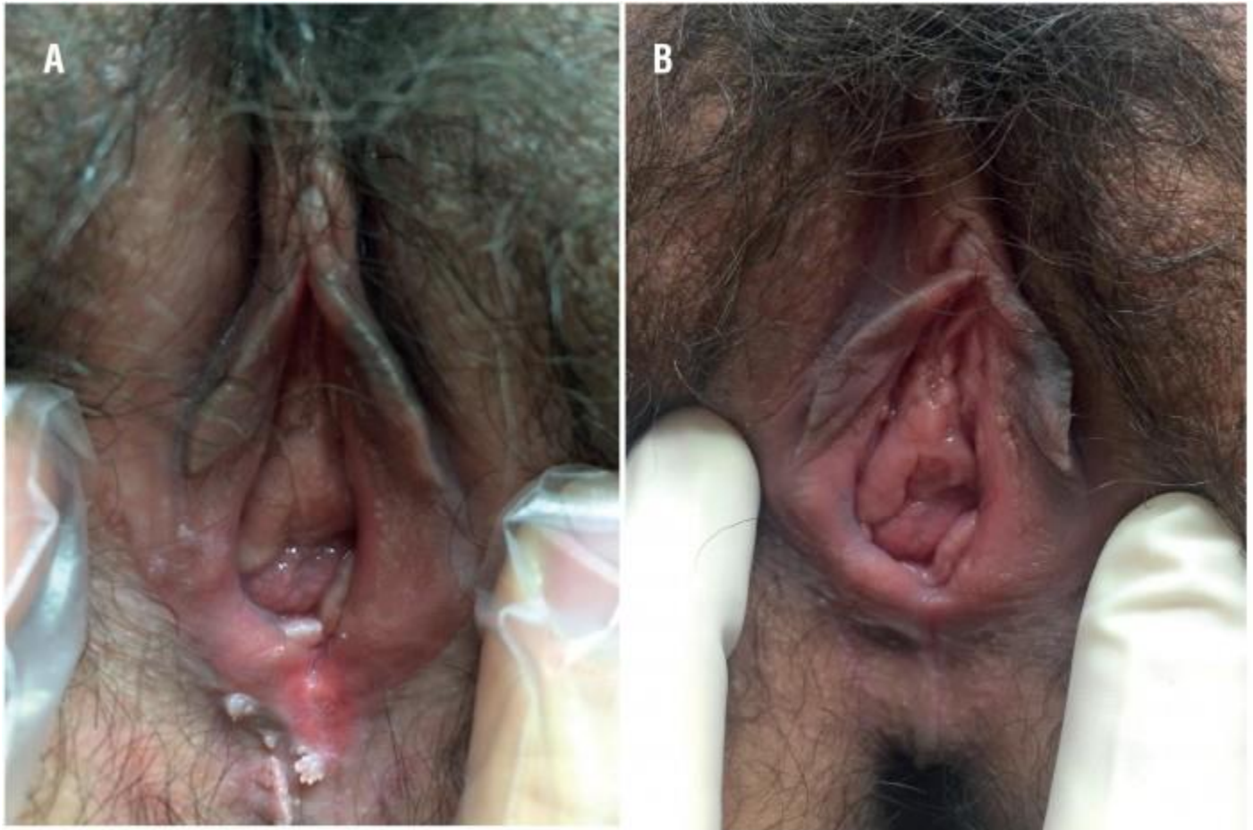
Hình ảnh bệnh sùi mào gà ở âm đạo bên bên cạnh của phái đẹp

Bệnh mào gà ở chị em giả dụ thí dụ không nhận ra xuất cũng thí dụ điều trị liệu liền có khả năng dẫn tới nguy cơ như ung thư vùng kín, ung thư cổ bé – cổ tử cung. Có thể lây lan giúp đối tác cũng như đặt biệt là lây nhiễm giúp con trong khi sinh đẻ.