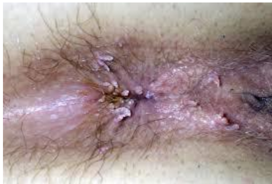
Hình ảnh bệnh sùi mào gà hậu môn thể nhú