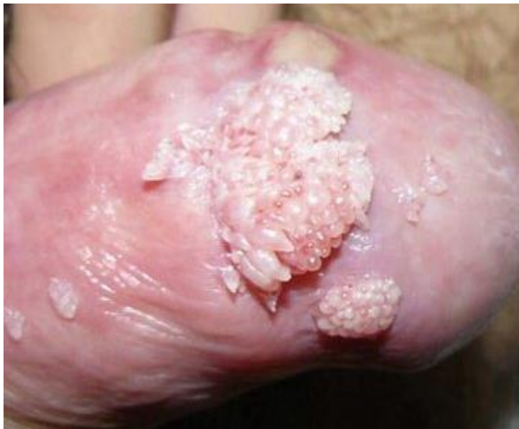
Hình ảnh bệnh mồng gà tại cậu nhỏ thời kỳ muộn