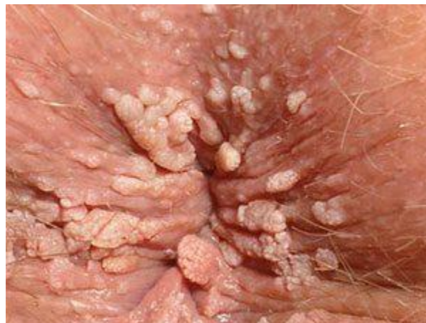
Hình ảnh bệnh mào gà lan rộng quanh ở khu vực hậu môn và tầng sinh môn