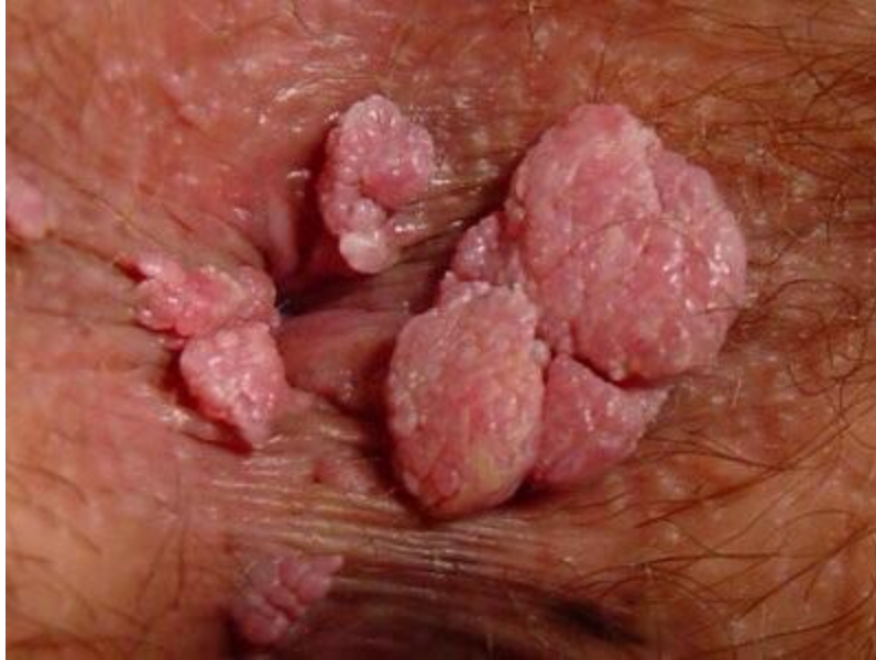
Hình ảnh bệnh mồng gà khổng lồ ở vùng lỗ đít vì bệnh nhân nhiễm bệnh để lâu không chữa trị liệu