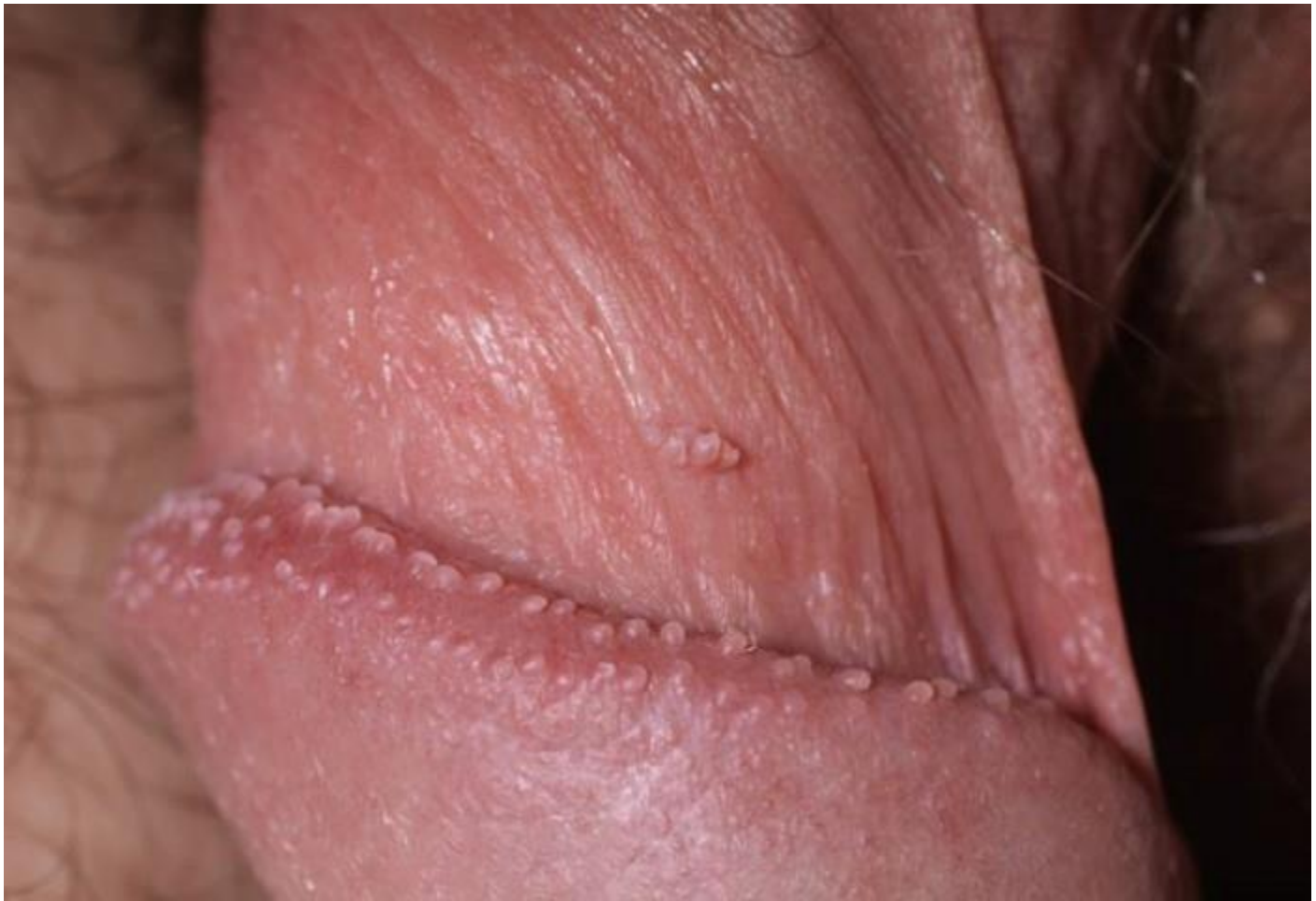
Hình ảnh bệnh mồng gà ở cậu nhỏ giai đoạn kịp thời