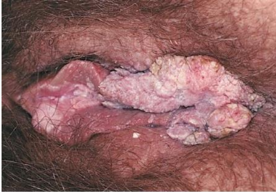
Bệnh sùi mào gà không lồ vùng kín ngoại trừ của nữ